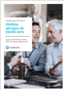
#7 गोपनीयता और सूचना की साज-संभाल