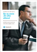
#4 हित का टकराव और उचित प्रतिस्पर्धा