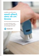
#3 सरकारी अधिकारी, संस्थाएं और अन्य हितधारक